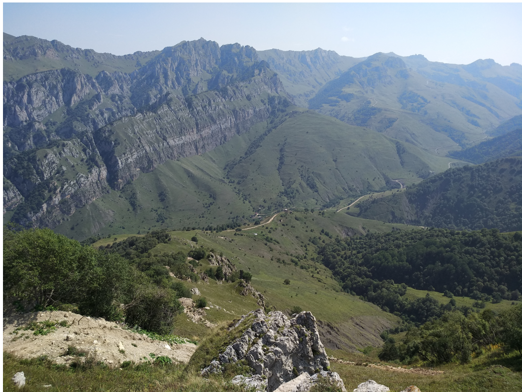
Рис. 1. Пример наилучшего рельефа: Шатойский район (Чеченская Республика), 2024 г.