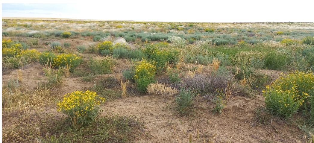
Рис. 2. Пример неблагоприятного рельефа: Тарумовский район (Республика Дагестан), 2024 г.

Равнинный РГР занимает обширную территорию СВК (48,3%) в пределах Терско-Кумской низменности (рис. 4). Здесь доминируют следующие типы ландшафтов: полупустыни, дельты (лугово-болотно-степные) и степи. В геологическом отношении данный РГР преимущественно сложен четвертичными отложениями (глины, пески, галечники и суглинки) [Забурова и Краснов, 2015]. В пределах РД здесь отмечаются высоты до 100 м, а крутизна склонов до 2°. На западе данного района в пределах РИ и ЧР расположены Терский и Сунженский хребты с абсолютными высотами до 707 м и до 872 м, соответственно. Наиболее значимые туристско-рекреационные ресурсы: бальнеологические (лечебные воды, пелоиды) и культурно-исторические (памятники истории и культуры, музейные комплексы). Также здесь расположены особо охраняемые природные территории (ООПТ) и объекты (Дагестанский заповедник, заказники: Ногайский, Тарумовский, Хамаматюртовский, Степной, Парабочевский